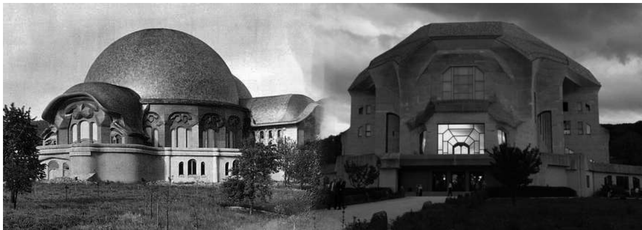
e com'è ora